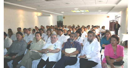
Conferencia al Personal de los SSY, Jurisdicción 1 21 de febrero de 2008.