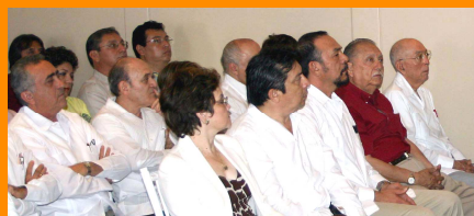
Miembros del H. Consejo Estatal de Arbitraje Médico.