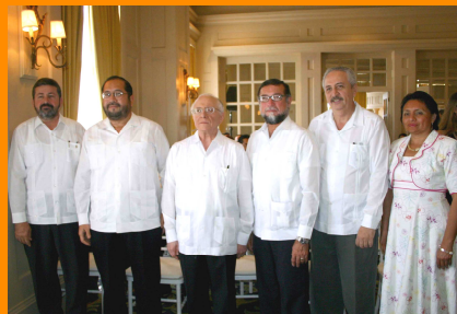
Comisionado y Miembros del H. Consejo Estatal de Arbitraje Médico.