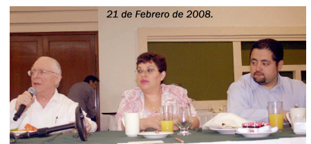
Mesa de Trabajo con Grupo de Asesores Médicos de diferentes especialidades.