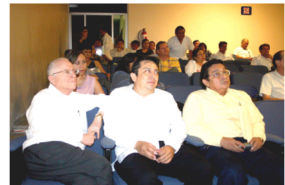
Conferencia Magistral a Miembros del Colegio de Médicos Auditorio del Hospital O'Horán. 20 de febrero de 2008.