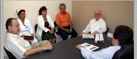
Mesa de Trabajo CODAMEDY — Hospital Materno Infantil de la SSY, el 27 de agosto de 2008.