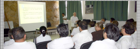
Conferencia Magistral sobre Calidad en el Acto Médico. Centro de Salud de Progreso, Yucatán, Jurisdicción Sanitaria No. 1.

La Capacitación, la Difusión en materia de Arbitraje Médico y la Homologación de los Procesos con la CONAMED reciben atención permanente en la CODAMEDY.